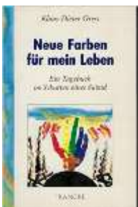
Klaus Dieter Kress Neue Farben für mein Leben