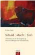
Chris Paul, Schuld - Macht - Sinn , Gütersloh 2010.

Sinnsuche und Trost nach dem Verlust eines Kindes. Schwerpunkt Suizid,.