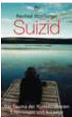
Manfred Otzelberger, Suizid . 5. Aufl. 2010

Das Trauma der Hinterbliebenen Erfahrungen und Auswege,.