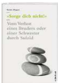
Samira Zingaro Sorge dich nicht!: 2013

Vom Verlust eines Bruders oder einer Schwester durch Suizid