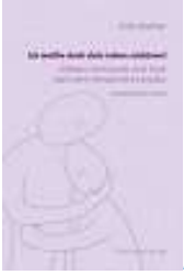
Erika Bodner, Ich wollte doch dein Leben schützen! Gnas 2002

Sinnsuche und Trost nach dem Verlust eines Kindes. Schwerpunkt Suizid,.