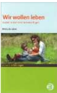
Petra Endres, Wir wollen leben : März 2009

Trost und Hilfe für Suizid-Hinterbliebene Gebundene Ausgabe