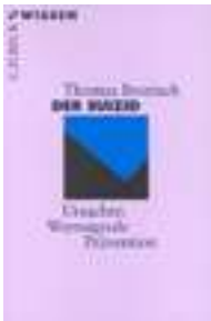
Thomas Bronisch, Der Suizid . 5., überarbeitete Auflage 2007

Wenn ein Mensch, den man liebt, Suizid begangen hat.