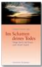
Johannes Thomas (Hg.), Im Schatten deines Todes , Gütersloh.

Arbeitsbuch für die Begleitung von Schuldfragen im Trauerprozess.