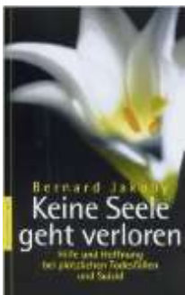
Bernard Jakoby Keine Seele geht verloren : 2013

Perspektiven nach dem Suizid: Lyrik und Prosa von Hinterbliebenen