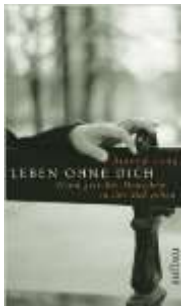
Bianca Lang, Leben ohne dich . Aufbau 2006