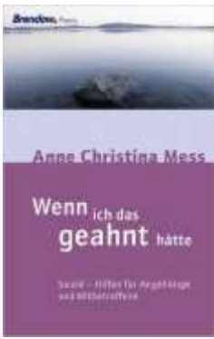
Anne Ch Mess Wenn ich das geahnt hätte: 2009

Suizid - Hilfen für Angehörige und Mitbetroffene