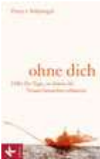
Freya von Stülpnagel, Ohne dich . Kösel 2009

Hilfe für Tage, an denen die Trauer besonders schmerzt .